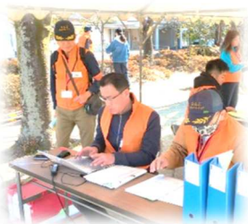
防災ボランティア訓練参