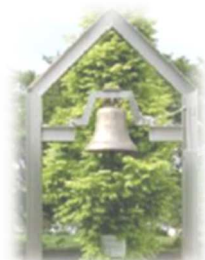
「平和の鐘」イメージ