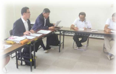
地域自治区での議会報告