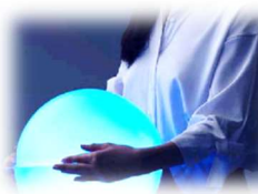
「サウンドハグ」イメージ