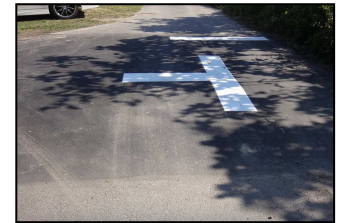
万年水たまり解消