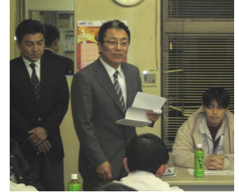
東海興業労組での挨拶