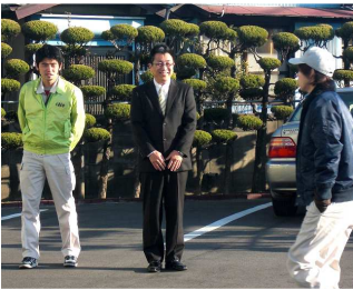
交通安全立哨・挨拶運動