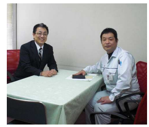
松尾製作所労組訪問