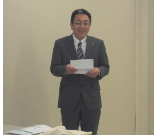
松尾製作所労組での挨拶