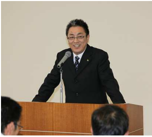
総合後援会での決意表明