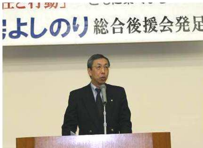
川上総合後援会会長 挨拶

皆様の温かいご支援に応え「住みよいまちづくり」に向けて、これから全力で頑張っていく決意を申し上げます。